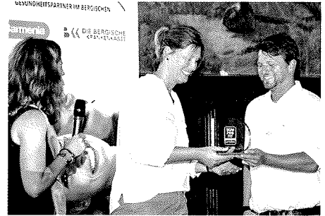
Ausgezeichnet Die glückliche Empfängerin des BGM ProFit Pokals